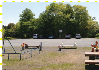
④幼児用玩具と岩倉広場