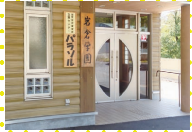
⑫岩倉学園と新規開設のパラソル玄関

50名の会議室有り、宿泊OK。 ※大学セミ、少年団サッカー、オリエンテーリングの宿泊合宿ができます。