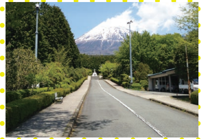
⑬300m道路から望む富士山 世界遺産登録! 素晴らしい写真が撮れます。